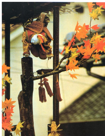
Fig. 4 - O fascínio do artificial como acrobacia.