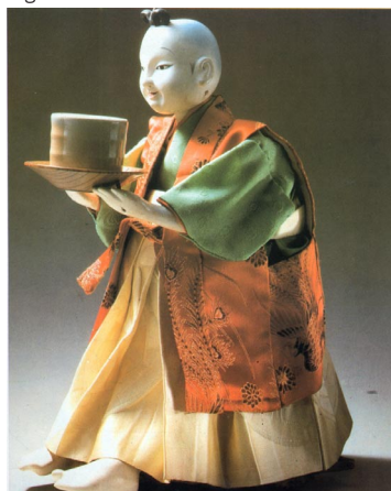
Fig. 3 - O autónomo como simbiose entre o humano e o maquinal (versão feudal japonesa).