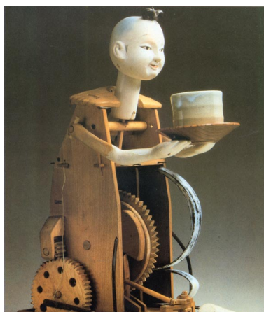
Fig. 2 - O modelo humano e o seu mecanismo escondido (séc. XVIII).

A IA, como procura de mecanismos que expliquem e explorem faculdades mentais, não se fica pelo que se conhece. Procura inventar novos mecanismos e faculdades, podendo as inovações ser apropriadas por via da educação.