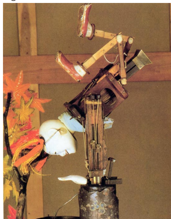
Fig. 5 - O segredo do comportamento revelado na estrutura.

Nesta versão das três ego-sabotagens históricas o Homem é colocado num espectro contínuo, que desde o inorgânico passa pelo restante reino animal, atravessa a história da sua cultura e percorre o passado pessoal. Deixa, assim, de ser descontínuo em relação ao mundo que o rodeia. No entanto, uma quarta e aparentemente maior descontinuidade existe ainda por desfazer. É a descontinuidade entre o Homem e a Máquina pensante, introspectiva e emocionante, entre a mente orgânica e a mente inorgânica. De facto, esta quarta descontinuidade deverá ser agora eliminada. Na verdade, a tarefa já começou com a informática, e neste processo o ego humano sofrerá outro rude choque, semelhante aos administrados por Copérnico, Darwin ou Freud.